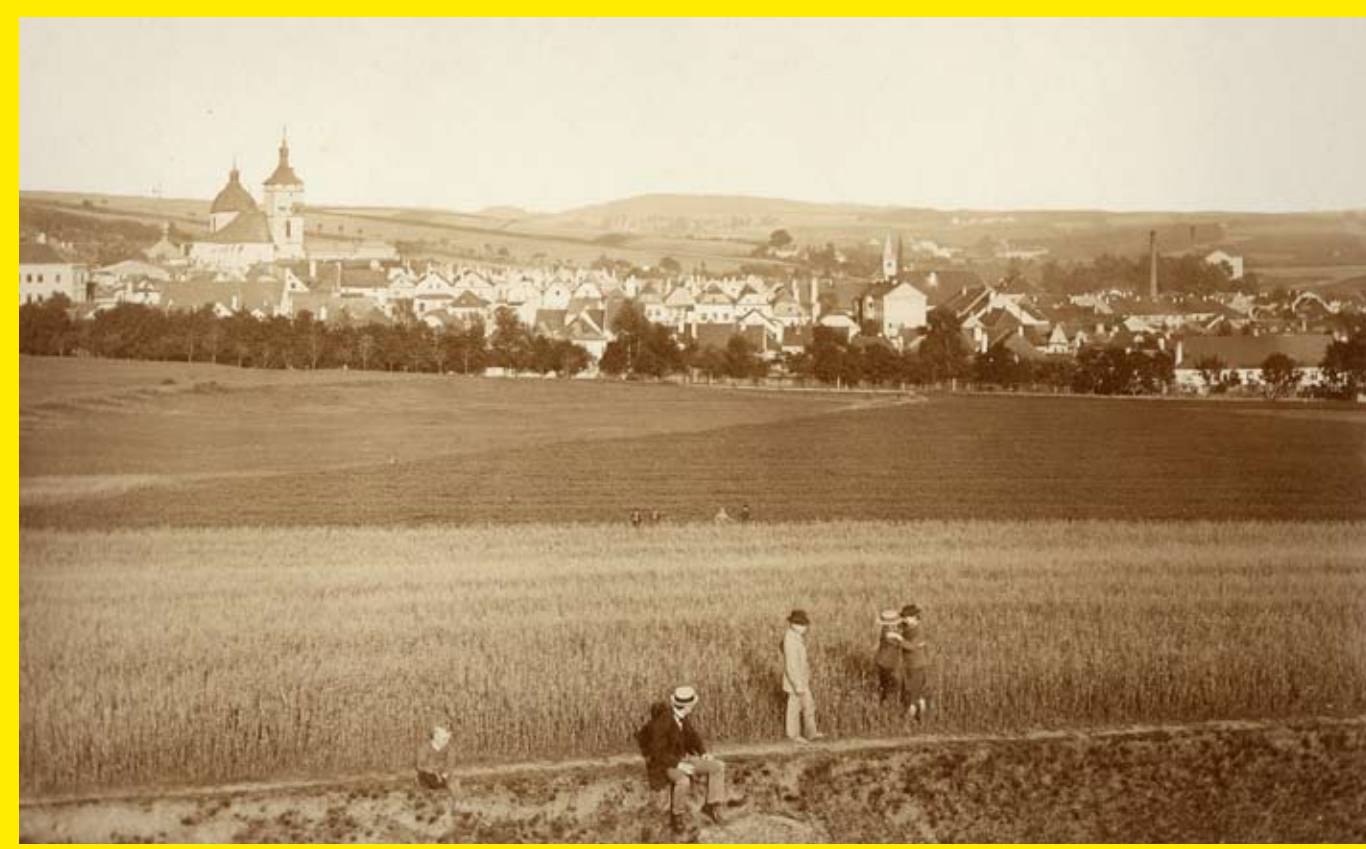
Pohled na Německý Brod, konec 19. století

První písemná zmínka o Brodě je z roku 1256. Město tedy tento rok slaví 750 let od svého vzniku. Vzhledem k velkému počtu německých mluvčích kolonistů získává město název Německý Brod.