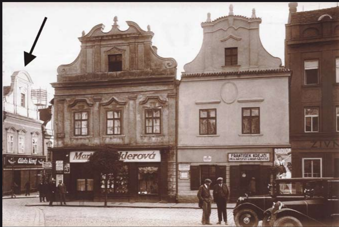
Dům č.p. 157 - modlitebna