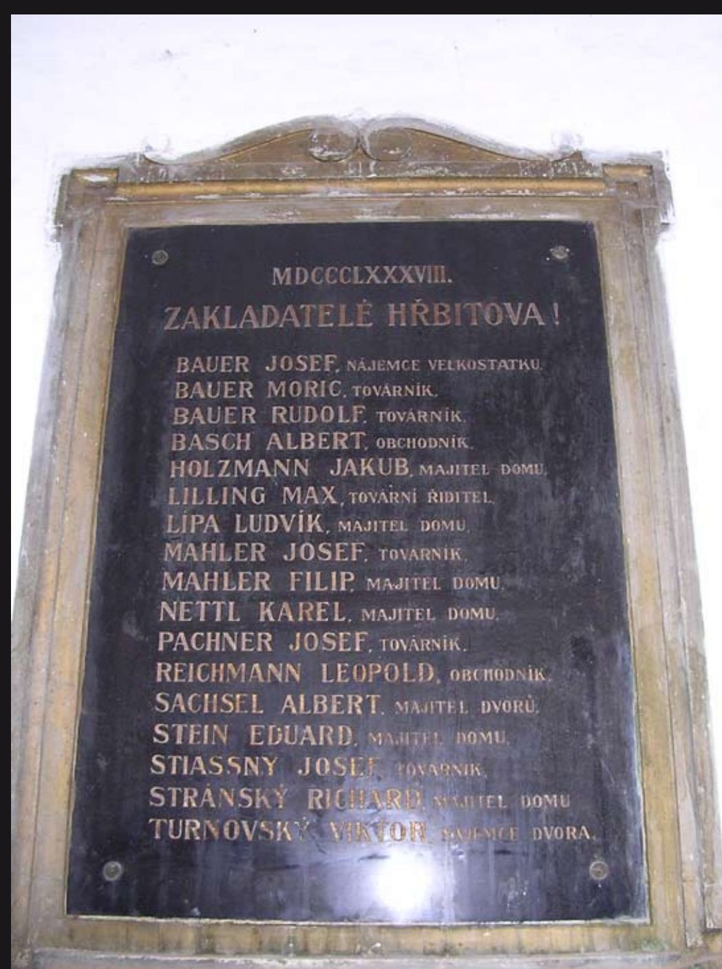
Pamětní deska se jmény zakladatelů hřbitova

Po druhé světové válce hřbitov postupně zarůstal a chátral, některé náhrobky byly poničeny, jiné odcizeny. V současné době probíhají restaurační práce. Hřbitov je volně přístupný veřejnosti.