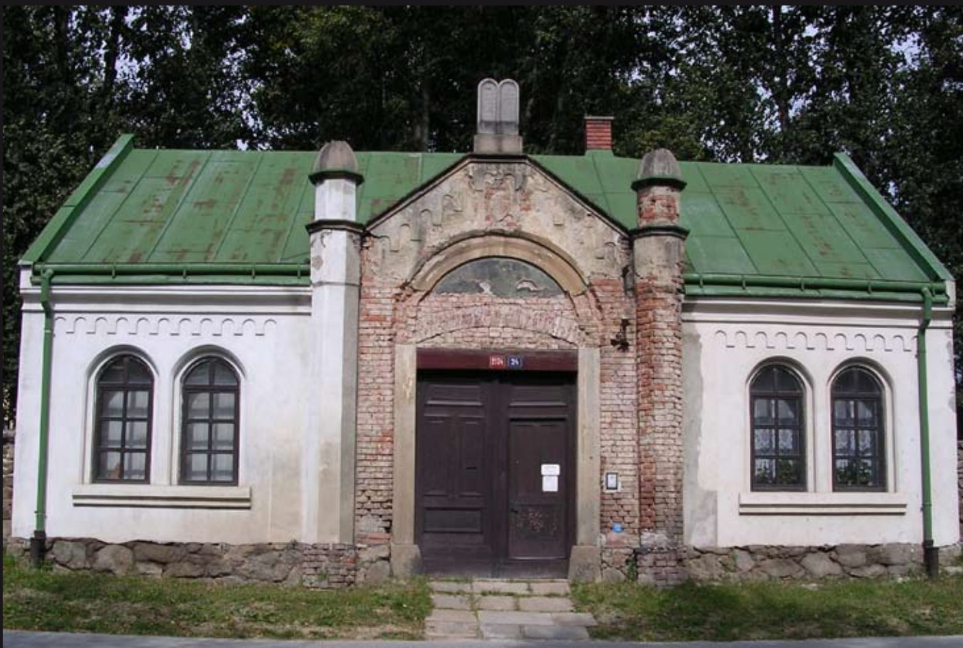
Obřadní budova, hrobnický byt - současný stav