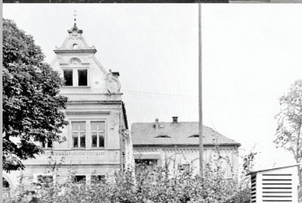
Nahoře: Rohový dům čp. 16, tzv. židovská fara, na snímku z válečných let. Snímek z roku 1960 ukazuje totéž místo po jeho demolici. V pozadí synagoga. Dole: Současná podoba budovy bývalé synagogy.

města. V roce 1940 byl objekt synagogy i domu č. p. 16 od města odkoupen organizací Hitlerjugend, která zde zřídila společenské prostory pro svoji činnost včetně ubytovny.