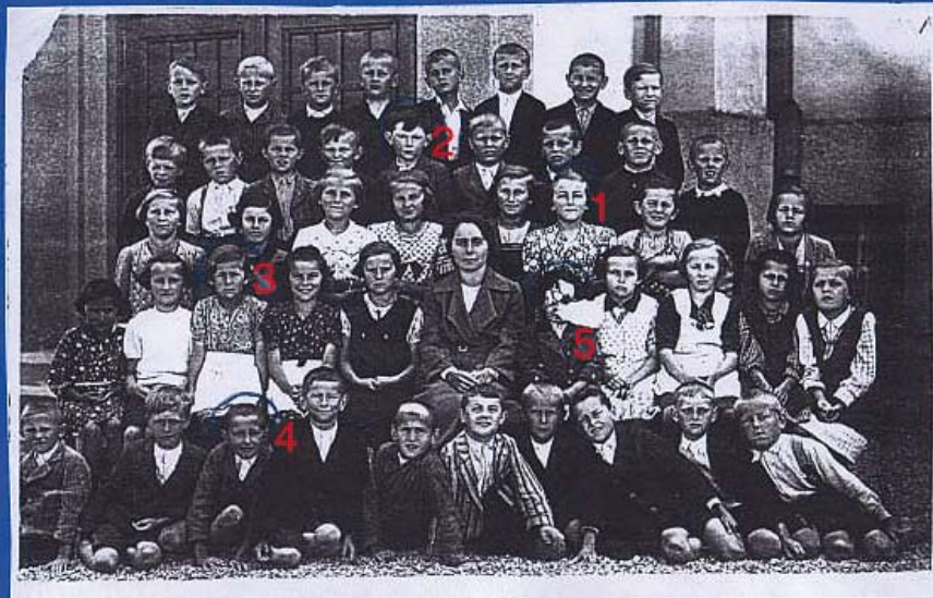
Fotografie ZŠ ve Velharticích